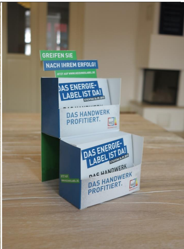
Flyer und Aufstellbox